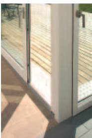
Geringe Schwellen- höhe