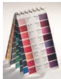
Aluminiumprofile in Farbenvielfalt