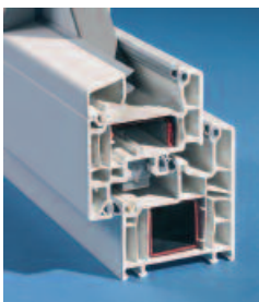
Mehrkammerprofil mit 70 mm Basis-Bautiefe